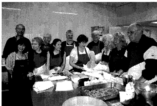
ja, nu lachen ze nog bij een glaasje wijn

Met grote koksmessen gewapend melden twaalf liefhebbers van de Japanse keuken zich ook dit verenigingsjaar weer regelmatig in één van de keukens van de De Rooi Pannen. Het is alweer de derde kookcursus die onze vereniging organiseert en hopelijk niet de laatste!