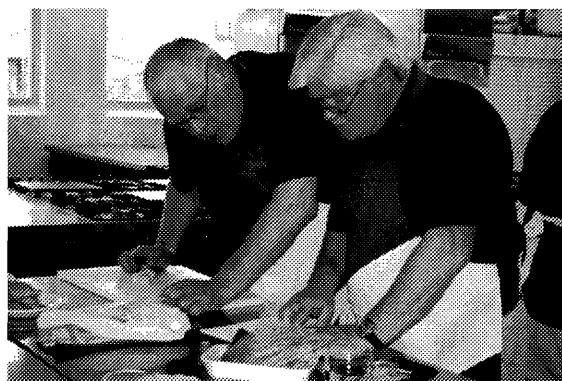
kijk, hier staat hoe het moet