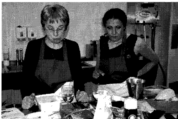
tja, waar smaakt dit nou naar?