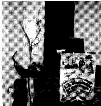
het schip 'Liefde' in ikebana-uitvoering