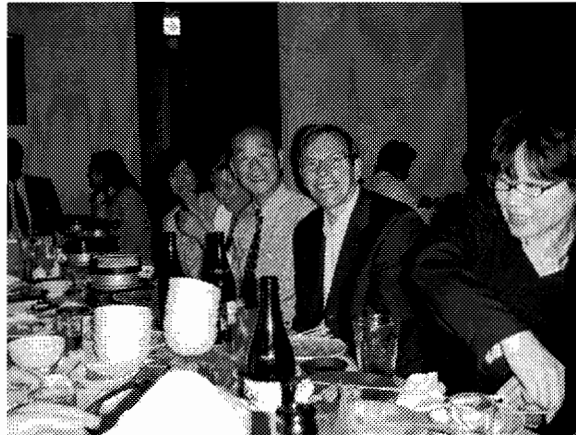
ook binnen is het Kampai!

digd om mee naar Tilburg te nemen. Het is de bedoeling deze fraaie voorbeelden van Japans artistiek werk op de ledenvergadering te tonen.