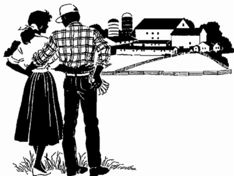
Our farm is our castle

Na de stal bezoeken we een nog in aanbouw zijnde gebouwtje dat straks als "De Huiskamer" onderdak zal bieden aan ouderen, die hoewel zij lichamelijk of geestelijk niet meer in een optimale conditie verkeren toch thuis willen wonen. Zij kunnen in deze huiskamer een of meer dagen in de week deelnemen aan begeleide binnen- en buitenactiviteiten.