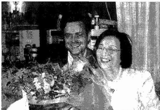
Het fornuis bij de hand

Met het eveneens goed bezochte 'Odawara Church Concert' werd de serie concerten afgesloten, maar eerst was er nog een Dutch welcome-party, aangeboden door de familie Bessho. Natuurlijk waren alle vrouwen weer van de partij, nu met overheerlijke