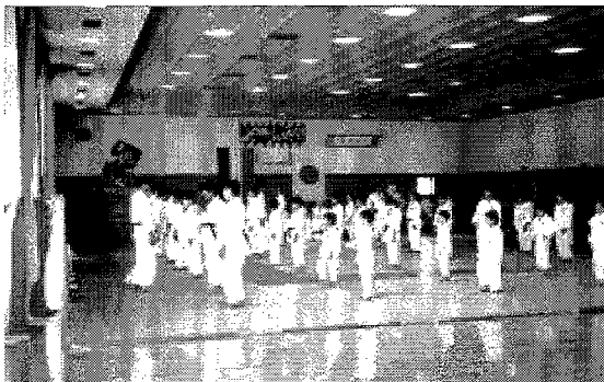
Opletten daar achteraan...

Er werd een bezoek gebracht aan een prachtige waterval, waar de legendarische 'Kintaro' volgens de legende opgroeide. Een heerlijke barbecue en een bezoek aan het natuurmuseum behoorden ook