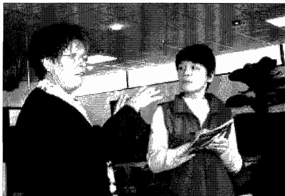
Uitleg voor de rondleiding

Maandag 24 september, het begin van een nieuwe werkweek. Dus moet er weer een serieus programma worden afgewerkt. De ochtend is gewijd aan een bezoek aan het Safaripark van de Beekse Bergen. Het bezoek is weliswaar interessant, maar de temperatuur is aan de lage kant en er zijn maar weinig dieren buiten. Er is dus betrekkelijk weinig te zien. Na de lunch vertrekken we weer naar Tilburg om ons voor te bereiden