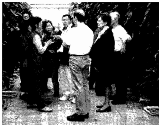
In de Paprika kas

Na de veiling bezoeken we het bedrijf van een naburige paprikateler. Daar zien we hoe