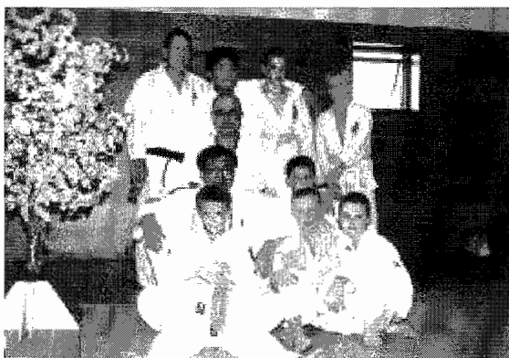
In goede handen

Enkele reacties van de kinderen uit de judodelegatie van Sportschool Le Granse, opgeschreven na een enerverende judoweek in Minamiashigara begin augustus. Het beeld is duidelijk: ze hebben alle-