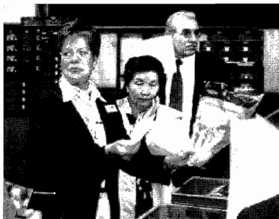
De producten worden deskundig gekeurd

In de avond is er een Farewell diner in het restaurant van de schouwburg en de dag daarop, woensdag 26 september, zwaaien we onze gasten weer uit. Vlucht JAL 412 vertrekt keurig op tijd naar Tokyo.